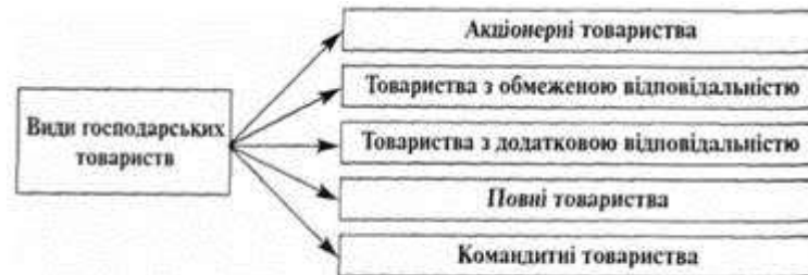
Рис.7. Види господарських товариств

Господарські товариства - це підприємства, установи, організації, які створені на засадах угоди юридичними особами і громадянами шляхом об'єднання їхнього майна та підприємницької діяльності з метою одержання прибутку. До господарських товариств належать акціонерні товариства, товариства з обмеженою відповідальністю, товариства з додатковою відповідальністю, повні товариства, командитні товариства