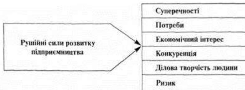
Рис. 3. Рушійні сили підприємництва

Підприємництво відображає відносини, що склалися в суспільстві, джерелом розвитку яких є внутрішні суперечності способу виробництва. А як відомо, суперечності - рушійна сила будь-якого розвитку, в тому числі й підприємництва (рис.3). Суперечність між продуктивними силами і виробничими відносинами - найбільш загальна суперечність економічної системи суспільства і підприємництва, що містять у собі цілу систему суперечностей, які виникають між різними їх елементами (між виробництвом і споживанням, зростанням потреб і можливістю задоволення їх, між різними формами власності, інтересами, попитом і пропозицією, технікою і технологією, робочою силою і засобами виробництва).