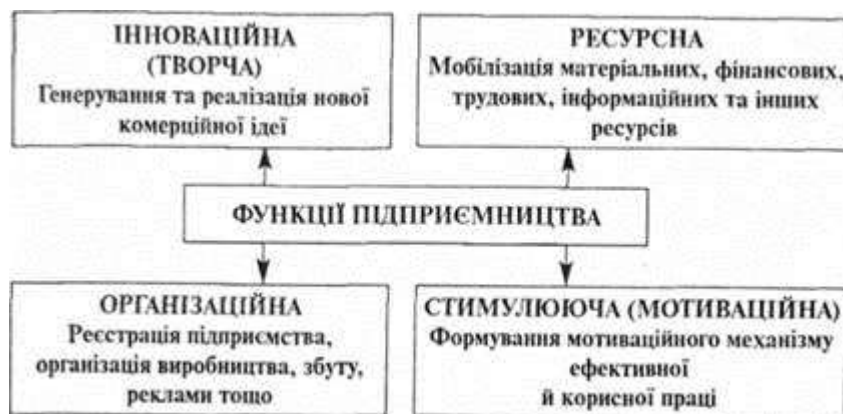
Рис. 2. Основні функції підприємницької діяльності

Сутність підприємництва більш глибоко розкривається через його основні функції - інноваційну (творчу), ресурсну, організаційну, стимулюючу (мотиваційну) (рис. 2).