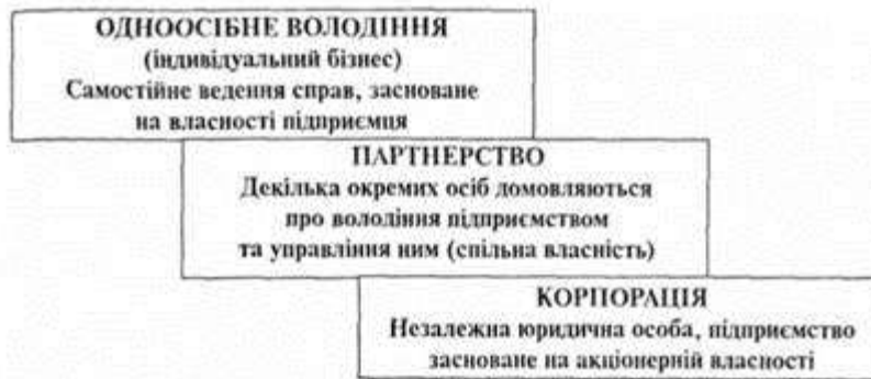
Рис. 5. Основні правові форми підприємницької діяльності

Одноосібне володіння - все майно фірми належить одному власникові, який самостійно управляє фірмою, одержує прибуток і несе повну особисту відповідальність за всі зобов'язання фірми. Одноосібні володіння мають свої переваги. По-перше, оскільки весь прибуток належить підприємцеві, він криво зацікавлений в ефективній праці. Зосередження прибутку в одних руках дає можливість безпосередньо використовувати його в інтересах справи. До того ж, прибуток підприємця в ринковій економіці розглядається як його індивідуальний дохід і оподатковується лише індивідуальним прибутковим податком (а не податком на прибуток, як в інших випадках). По-друге, у власника фірми витрати на організацію виробництва невеликі. Його управлінські рішення негайно втілюються в життя. Він непідзвітний співвласникам чи будь-яким керівним органам. Невеликі розміри фірми дають змогу підприємцеві підтримувати прямі контакти зі своїми працівниками та клієнтами. Повна незалежність дуже цінується підприємцями. По-третє, одноосібному володінню властива простота в організації фірми та її ліквідації. В обох випадках досить лише рішення самого підприємця.