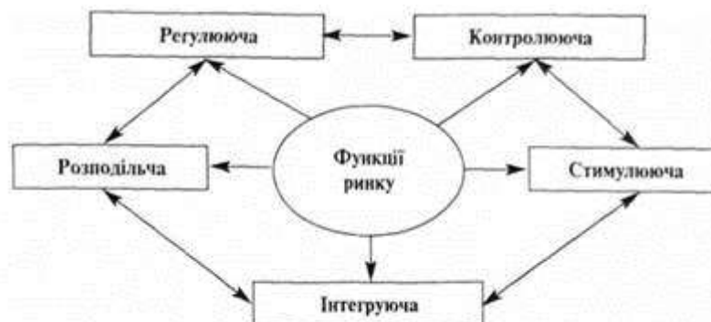
Рис. 1. Основні функції ринку

Більш повно сутність ринку розкривається через функції, які він виконує. Головні з них такі: регулююча, контролююча, розподільча, стимулююча, інтегруюча (рис. 1).