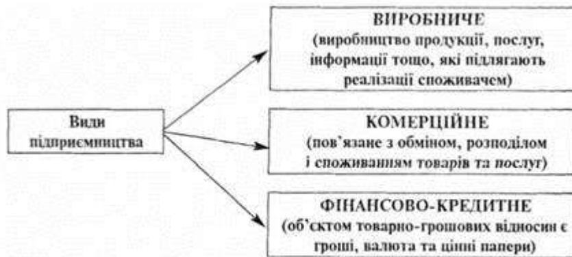
Рис.4. Види підприємництва

кредитне підприємництво (рис. 4). Як окремі види підприємницької діяльності виділяють також страхове та інноваційне підприємництво.