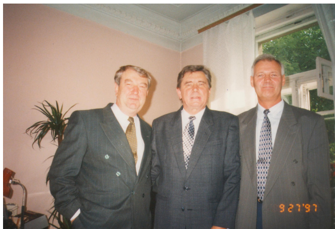
Друзі та наставники Одеської філії Української Академії державного управління