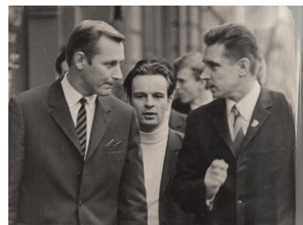
Ювіляр доводить переваги соціалістичного ладу прем'єр-міністру Фінляндії