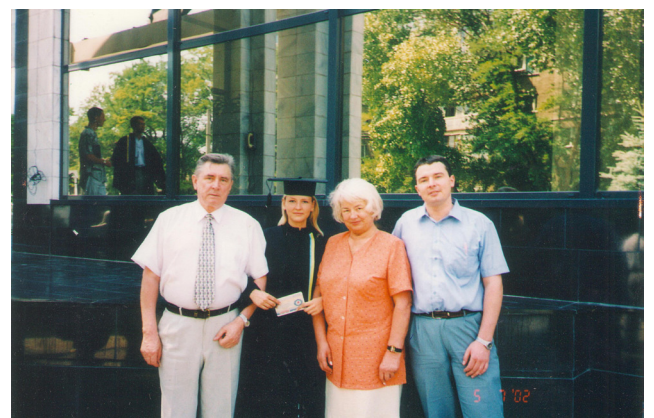
Сім'я у повному складі