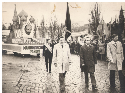
Малиновський район на марші