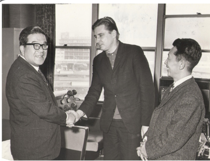
Закріплення контактів між Одесою та Йокогамою

медаллю «П'ятдесят років Ціліні», Грамотами Верховних Рад УРСР та Казахської РСР, Грамотою Президента України "За сумлінну працю", орденом «За заслуги» 3-го ступеня, орденом «Знак пошани» 3-го ступеня, Почесною відзнакою Голови Одеської обласної держадміністрації, Почесною грамотою Міністерства освіти і науки України.