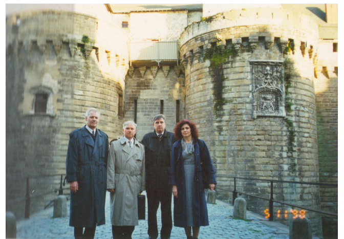
У Франції (м. Нант)