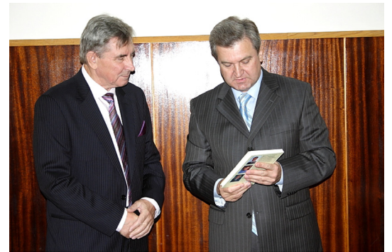
З людиною, якій небайдужа доля нашого закладу