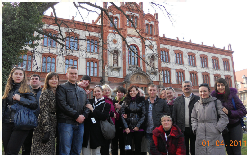
Слухачі систематично проходять стажування в європейських країнах. У березні-квітні 2011 року слухачі факультету державного управління проходили стажування у Вищій школі державного управління поліції і права міста Гюстров (Німеччина).

пл. Грецька, 46 тел. (048) 715-50-99 «ЕС-Сервіс» Тираж- 200 екз.