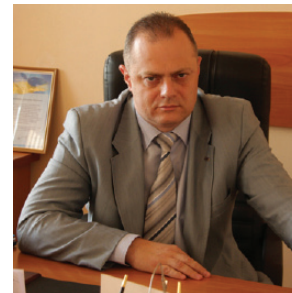
Челомбитко Александр Иванович Глава Гагаринської райдержадміністрації міста Севастополь

Хочу пожелать всем: пусть жизнь будет полна любовью родных, верностью друзей, уважением коллег! Счастья, добра и мира вам и вашим родным!