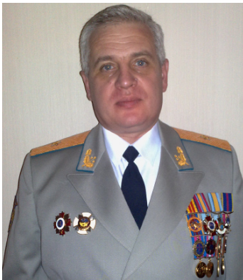
З повагою Слухач 2 курсу заочної форми навчання ОРІДУ НАДУ при Президентіві України генерал-майор