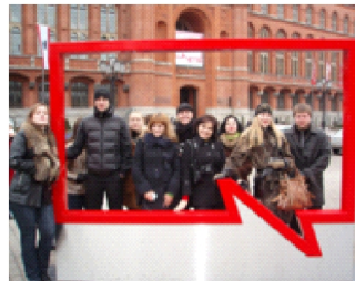
Група слухачів факультету державного управління у м. Берлін під час навчального візиту до Німеччини

Відділ міжнародних зв'язків докладає максимальних зусиль для розвитку інституту, здійснює усі види міжнародних контактів, спрямованих на подальший розвиток Інституту та його підрозділів. Серед основних завдань відділу: встановлення та інтенсифікація партнерських зв'язків із зарубіжними навчальними закладами та організаціями; організація стажувань за кордоном;