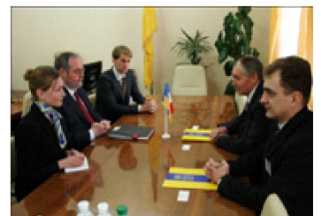
Зустріч із Надзвичайним й повноважним послом Франції в Україні п. Жаком Фором

Протягом 15-річного періоду свого існування ОРІДУ встановив та підтримує партнерські відносини з низкою посольств і консульств іноземних держав, які мають свої представництва в Україні, а саме: Посольством США в Україні, Посольством Німеччини в Україні, Посольством Великобританії в Україні, Посольством Франції в Україні, Генеральним Консульством Республіки Польща в Одесі, Генеральним Консульством Болгарії в Одесі, Генеральним Консульством Греції в Одесі, Генеральним Консульством Румунії в Одесі, Генеральним Консульством Російської Федерації в Одесі, Генеральним Консульством КНР в Одесі, а також, з Представництвом Європейської Комісії в Україні, Місією Європейського Союзу з прикордонної допомоги Україні та Молдові тощо.