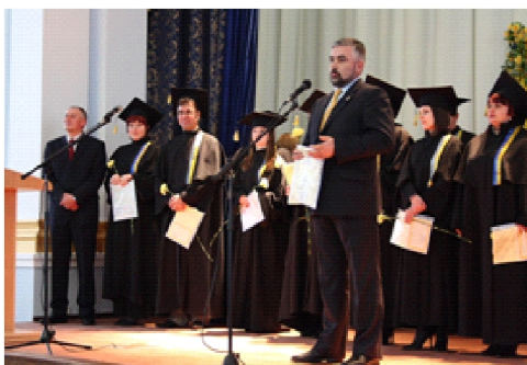
Вручення дипломів з відзнакою магістрам державного управління, 2009 рік

З цією метою за Указом Президента України від 30 травня 1995 року № 398 й була створена Українська (нині Національна) Академія державного управління при Президентові України як головний вищий навчальний заклад у загальнонаціональній системі підготовки, перепідготовки та підвищення кваліфікації державних службовців і посадових осіб місцевого самоврядування. Згодом, за Указом Президента України від 11 вересня 1995 року, в м. Одесі було створено філіал цієї Академії. Сучасну назву – Одеський регіональний інститут державного управління Національної академії державного управління при Президентові України – закладу надано Указом Президента України від 21 вересня 2001 року.