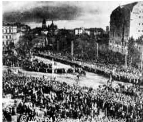
Мітинг на Софійській площі з нагоди проголошення Акта злуки ЗУНР і УНР. Київ, 22 січня 1919 р.

УНР як незалежна держава постала рівно за рік перед цим. ЗУНР (Західно-Українська Народна Республіка) постала в листопаді 1918 року, і відразу ж розпочався процес об'єднання: зазбручанська Українська національна рада надіслала до Києва свою делегацію для переговорів із гетьманом Павлом Скоропадським. Після зміни влади переговори велися з Директорією. 1 грудня 1918 року у Фастові був укладений «передвступний договір» про «злуку обох українських держав в одну державну одиницю». 21 січня 1919 р. в Хусті Всенародні збори ухвалили приєднати до Української Народної Республіки Закарпаття. Наступного дня у Києві в урочистостях з нагоди свята Злуки брала участь делегація - тридцять шість чоловік - Західної області УНР.