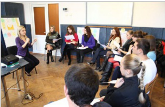
Семинар, проводимый в рамках Тренингового Центра

За это время мы успели познать много нового, научиться тому, что, уверены, поможет каждому из нас стать профессионалом в нашем деле.