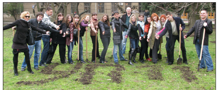
Субботник при участии слушателей УП 2

Трепетно вспоминаются моменты совместного посещения клубов, театров и даже субботника.