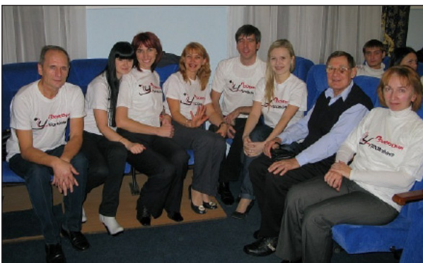
Преподаватели кафедры Управление проектами

Нет, это не просто полтора года обучения – это часть жизненного пути, на котором нам встречались люди, вдохновляющие на победу, успех, дающие мощный заряд веры в свои силы и безумное желание быть лучшими в своем любимом деле.